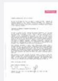
Garantie Bancaire Nº00125-02-1957580 Millennium BCP