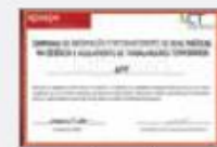
Certificat de "bonnes pratiques" ACT / APESPE