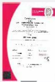
Certificat ISO 9001:2008 NºPT00293-2 Bureau Veritas