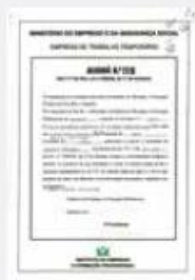
Licence d'Exploitation Nº119 de 1993 · IIEFP

É associada da APESPE, e por sua vez da EUROCIETT e CIETT, e está reconhecida pelo Provedor da Ética Empresarial e do Trabalho Temporário - PEETT.